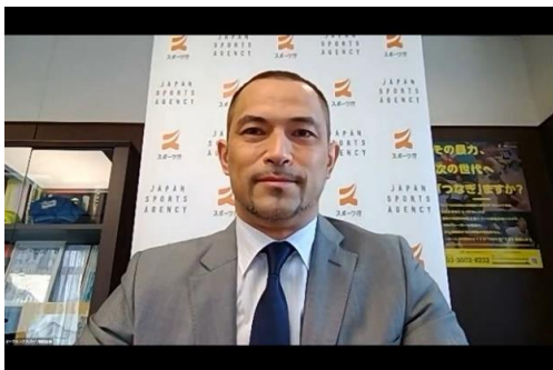
スポーツ庁 室伏長官挨拶