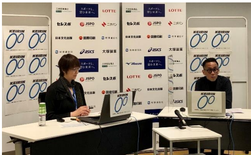
プログラムNo. 10 スポーツにおける暴力行為根絶に向けた 取組と今後の方向性